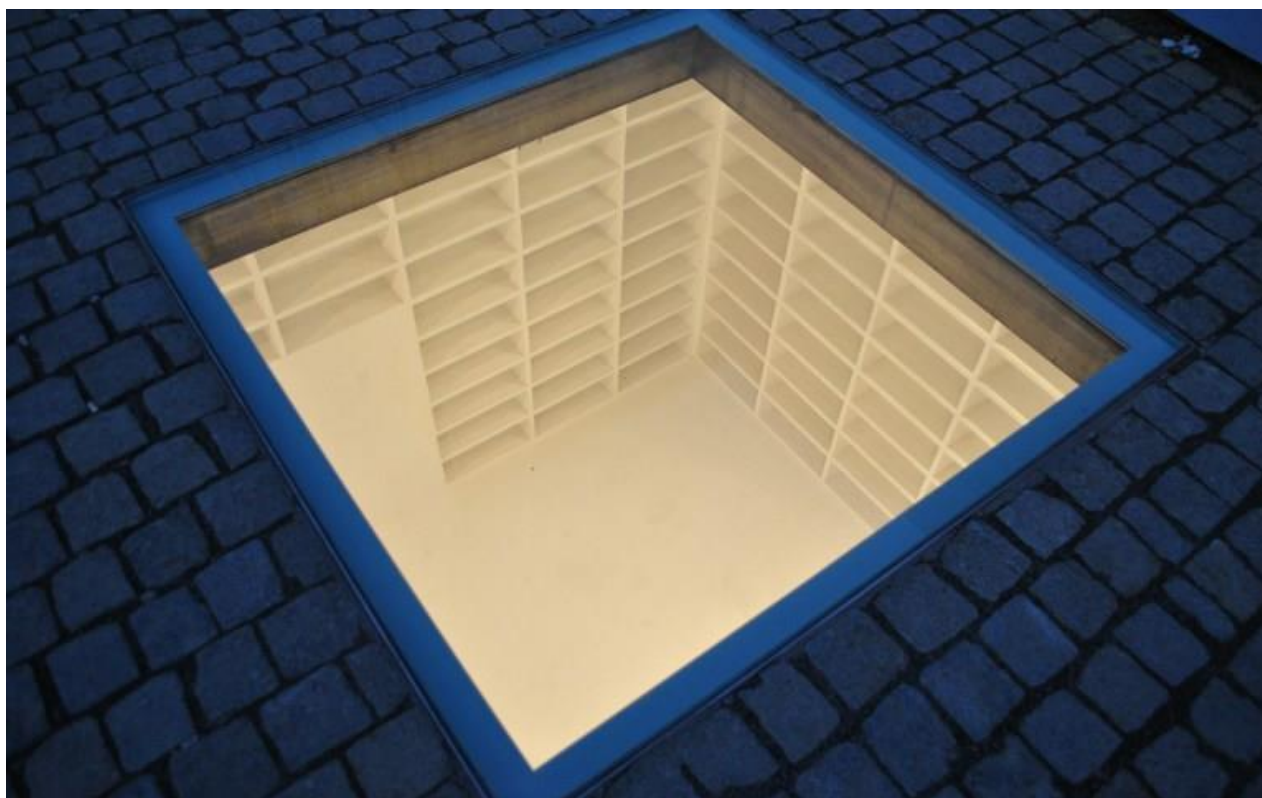
Bebelplatz, Berlino, The library , di Micha Ullman

«Là dove si bruciano i libri si finisce per bruciare anche gli uomini» (Heinrich Heine)